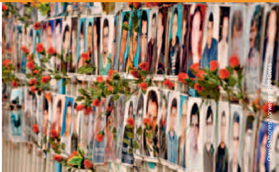
Clay Saittonnes/Norwegian Red-Cross

کمیته‌ی بین‌المللی صلیب سرخ نیازهای خانواده‌ها را شناسایی کرده و از طریق فعالیت‌های مختلف و پشتیبانی و بسیج سایر نهادها و در رأس آن‌ها مسئولین کشوری، پاسخی جامع برای کمک به این خانواده‌ها ارائه می‌کند. این کمیته، از مشارکت مستقیم و تنگاتنگ اتحادیه‌های خانواده‌ها، جمعیت ملی صلیب سرخ یا هلال احمر و سایر فعالان با خانواده‌های مفقودین اطمینان حاصل می‌کند. از سوی کمیته‌ی بین‌المللی صلیب سرخ پیوسته در تلاش برای افزایش آگاهی است، زیرا هرچه آگاهی بالاتر باشد، تعداد افراد ناپدید و گورهای بی‌هویت و خانواده‌های آسیب‌دیده از این معضل کمتر خواهد بود.